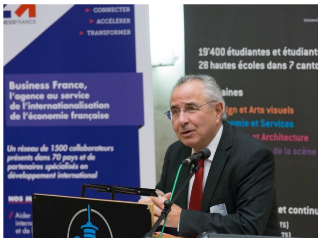
L'allocation de S.E Monsieur L'ambassadeur René Roudaut lors du forum 2015